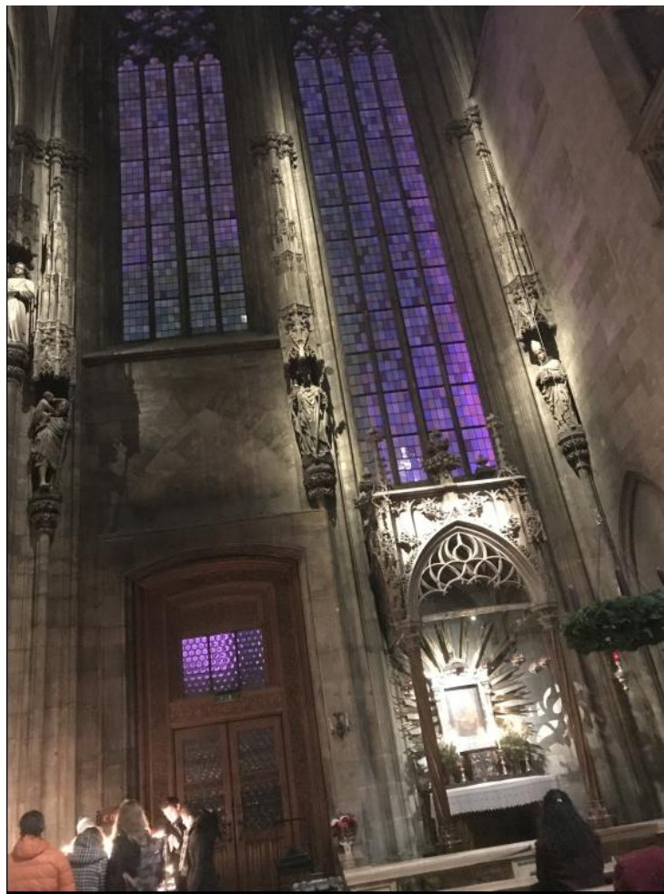
Catedrala Sf. Ștefan