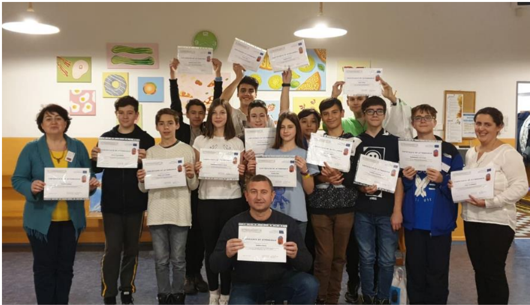
După înmânarea certificatelor