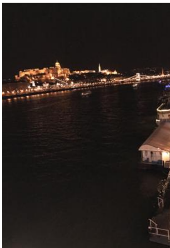
Vedere de pe un pod ce traversează Dunărea