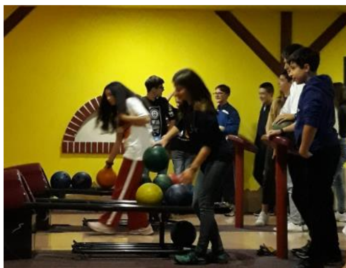
Distracție la bowling