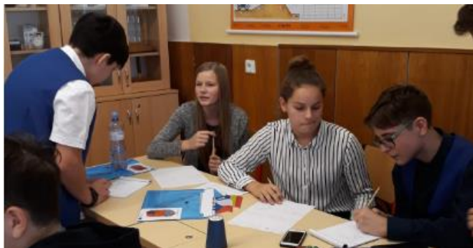
La ctivități în echipe mixte

care am încercat-o. Aici atmosfera a fost una foarte animată și mai ales amuzantă, deoarece nu prea avea nimeni îndemânare.