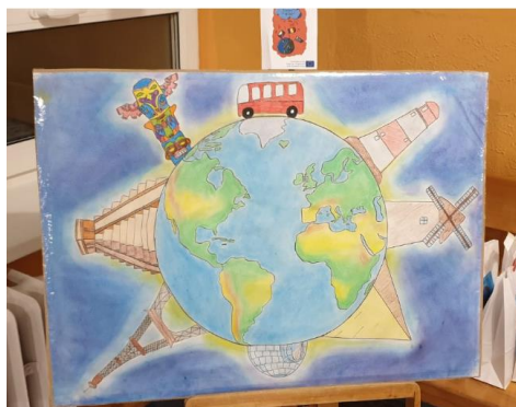
Desen reprezentând Erasmus +