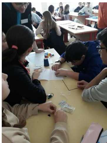
Lucrând la circuit

-O experiență inedită și care m-a pus pe gânduri fost când am mers la muzeul “Science and Tehnology Center”, un loc special unde am avut ocazia să experimentăm anumite aplicații fizice și să observăm efectele unor accidente rutiere și ale unor stări fizice (de exemplu starea de ebrietate unde vizibilitatea era mult distorsionată). Mi-a atras atenția o bancă realizată din componente electronice, această bancă mi-a dat idei de design pentru viitori roboți.