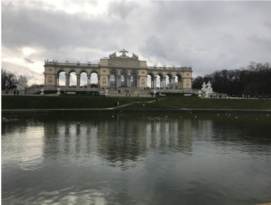
Vedere din curtea Palatului Schönbrunn

- Matinali, așa cum călătorului îi șade bine cu drumul, am pornit în descoperirea minunatei capitale a Austriei. Obiectivul turistic propus pentru vizitare a fost Palatul Schönbrunn, pe care l-am vizitat parțial. Am parcurs aleile sale cu statui, serele și Grădina Zoologică. Deși nu era pentru prima dată când am văzut o grădină zoologică, a fost pentru prima dată când am văzut un urs Panda. În ciuda dimensiunii sale mari nu părea deloc feroce, ci mai degrabă aducea cu o jucărie de pluș.