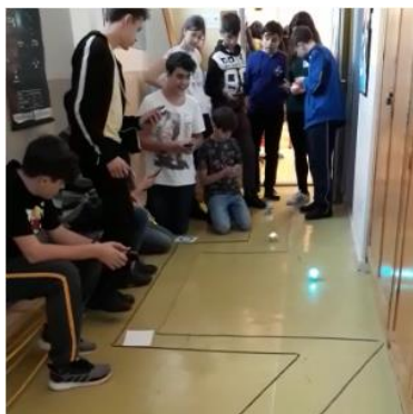
Experiența cu roboții sferici